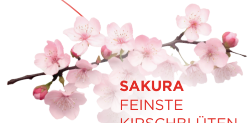
SAKURA FEINSTE KIRSCHBLÜTEN AUS JAPAN