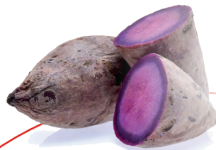
UBE VIOLETTE YAMSWURZEL VON DEN PHILIPPINEN

In dieser Trendübersicht präsentieren wir Ihnen fünf ikonische Geschmacksrichtungen – Matcha, Ube, Yuzu, Sesam und Sakura. Obwohl sie in der asiatischen Genusswelt bereits eine lange Tradition haben, gewinnen diese Aromen aktuell zunehmend an Relevanz für innovative Anwendungen. Ihre Vielseitigkeit und charakteristische Wiedererkennbarkeit eröffnen neue Impulse für differenzierte und zukunftsfähige Produktkonzepte.