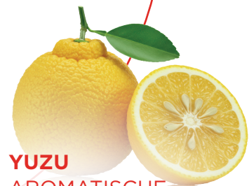
YUZU AROMATISCHE ZITRUSFRUCHT AUS JAPAN